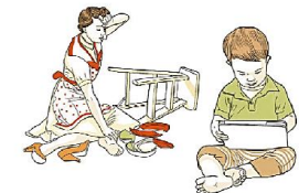
Может иногда казаться глухим, не вздрагивать и не оборачиваться на громкие звуки, но в другое время реагировать на обычные звуки...