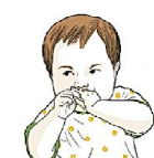
Может кусать себя