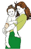
Может явно и отчаянно сопротивляться объятиям, поцелуям и не давать брать себя на руки...