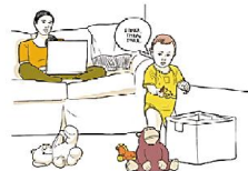
Автоматически повторяют слова, но обращенные к другим (эхолалии)