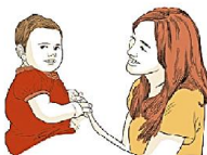
Избегают контакта «глаза-в-глаза»

Вместо этого они пользуются руками других людей, подводят взрослых к тем предметам, с которыми хотят чтобы взрослые что-то делали. Другие дети могут рано начинать говорить и запоминать много слов, но не используют их для того, чтобы общаться.