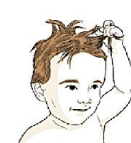
Может вырывать у себя волосы клочьями

В некоторых случаях стремление к необычным ощущениям или сниженная болевая чувствительность могут приводить к тому, что ребенок сам себе наносит травмы и причиняет вред. Это поведение встречается не очень часто, но вред бывает серьезным.