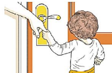
Используют «управляемую руку» взрослого