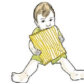
Может упорно пытаться есть несъедобные предметы: одежду, простыню, матрас...