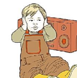
Может не переносить музыку