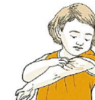
Царапать и отдиирать кожу и раневые поверхности (корочки)