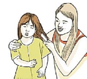
Может не переносить прикосновения к коже, голове и волосам, (сопротивляться раздеванию или мытью, стрижке волос)

Дети с аутизмом могут иметь особенности восприятия, т.е. обладать обостренной чувствительностью. Например, могут с трудом переносить некоторые ощущения: шум, музыку, мигание лампочек, прикосновение одежды, запахи и т.п., которые другим кажутся вполне комфортными по интенсивности.