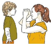
Не улыбается в ответ на улыбку