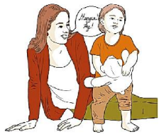
Не реагирует на свое имя

Нарушения социального взаимодействия — самые важные симптомы аутизма. Часто маленький ребенок с аутизмом ведет себя так, будто он настроен «на свою волну», он может не проявлять интереса к играм других детей и даже упорно отказываться от участия в общих играх, его бывает сложно заинтересовать чем-то, что ему предлагает взрослый, он не повторяет действия, движения и звуки за взрослыми.